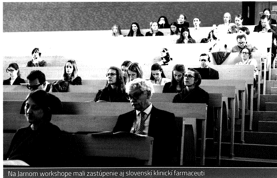
Na Jarňom workshopu mali zastúpenie aj slovenskí klinickí farmaceuti