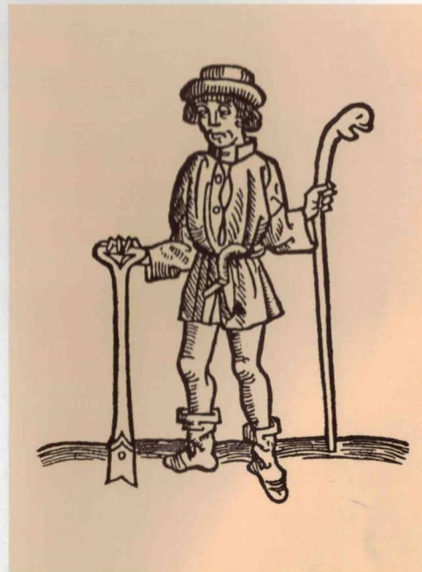
Pozdně středověký zemědělec s holí a úzkým rýčem (Stephanus Boek van dem Shakspele, Lübeck, 1498, dřevorez).

RÝČ A PŘESLIČE • SOCIÁLNÍ STATUS ROLNÍKA • STRUKTURA OSÍDLENÍ: DVORY A VESNICE • RADONICE NAD OHŘÍ A DALŠÍ ČESKÉ ZEMĚPANSKÉ DVORY • STŘEDOVĚKÉ VESNICE A PUTUJÍCÍ ZEMĚDĚLCI • URBÁŘE • TVAR POLÍ • CHLĚB NA HNOJI VYROSTLÝ • DALŠÍ TŘI PŘÍBĚHY: TENTOKRÁT O LESNÍCH PŮDÁCH • LUPINA A LES • MNIŠKA, BÍLÝ LESMISTR A ZALESŇOVÁNÍ KALAMITNÍCH HOLIN • Z VÁLČNÝCH ZÁPISKŮ MÉHO DĚDEČKA